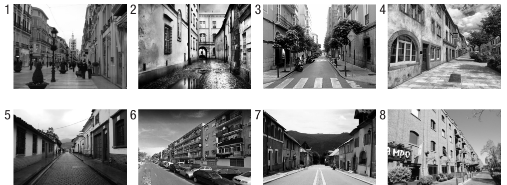
Imágenes para representación de "Lo Real"